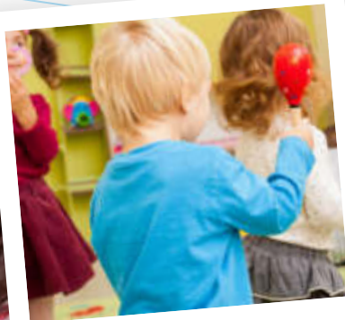
Música y Movimiento