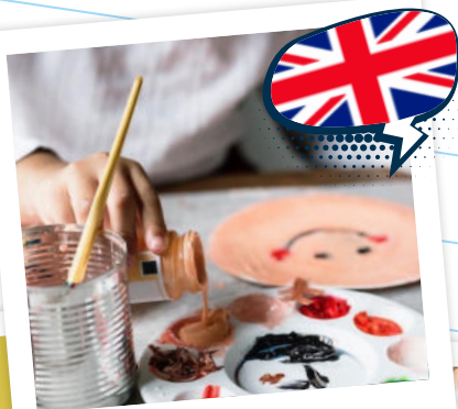
Art Attack en inglés