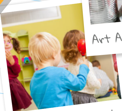
Música y Movimiento